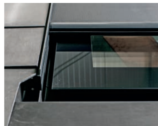
Untere Ausklinkung der Eternitplatte für seitliche Entwässerung.