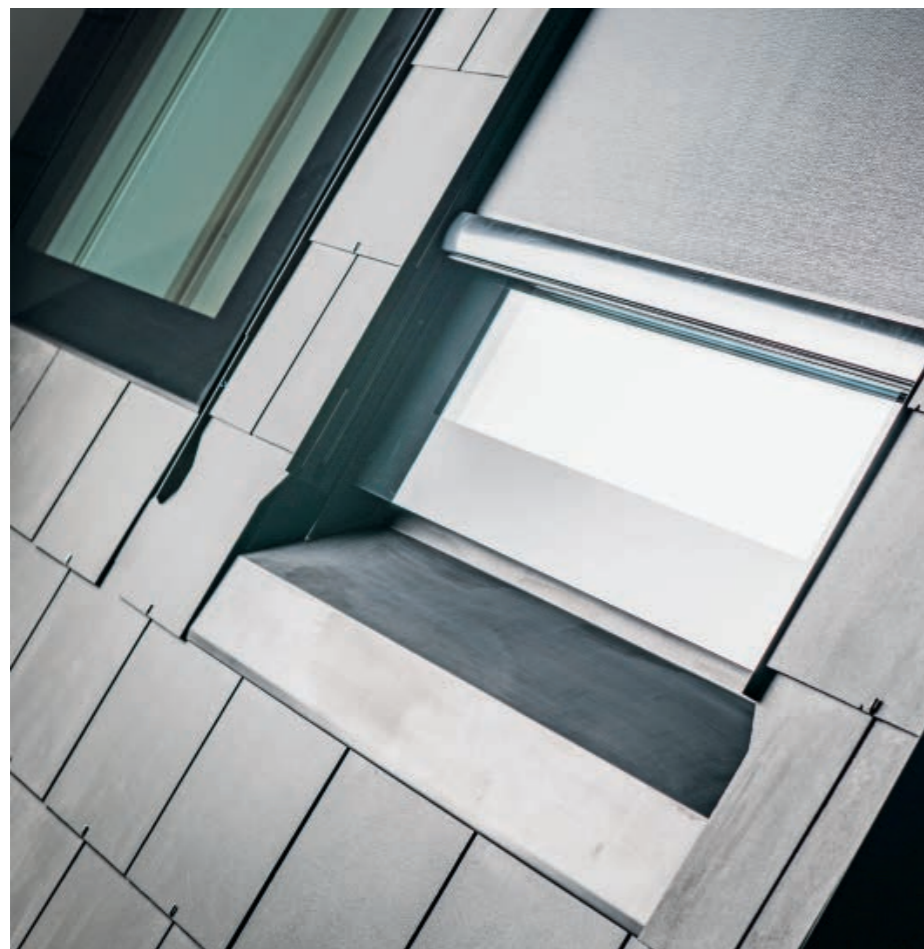
Einlaufblech mit halb geschlossener Beschattung.

auch als Verdunkelung anwendbar. Die seitlichen Führungen sind in einem zweiteiligen Spenglerblech integriert und praktisch unsichtbar. Die äussere Beschattung Typ «dachbündig» liefern wir in allen verfügbaren Materialien. Diese kann bei den Fenstertypen s:209, s:211 E, s:211 EDA, s:213 sowie bedingt bei s:201 und s:203 verwendet werden.