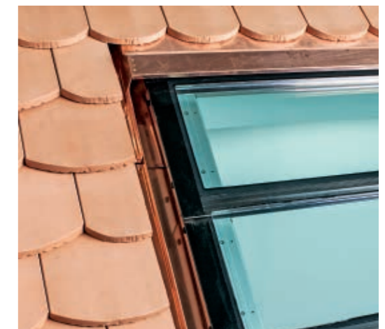
Oberer Anschluss mit Ziegeleinlaufblech.