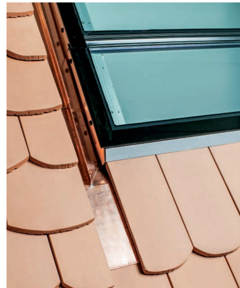
Unterer Anschluss mit geschlossenen Schuppen.

mit der letzten Schuppe in geschlossenem Zustand überdeckt befestigt. Dabei wird die Ziegelstruktur genau eingehalten. Den Eindeckrahmen liefern wir in allen verfügbaren Materialien. Er kann bei den Fenstertypen s:209, s:211 E, s:211 EDA, s:213 sowie bedingt bei s:201 und s:203 verwendet werden.