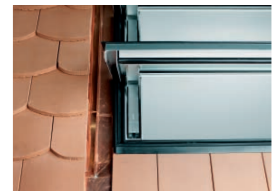
Unterer Anschluss mit offenen Schuppen und seitlichem Rinnenblech.